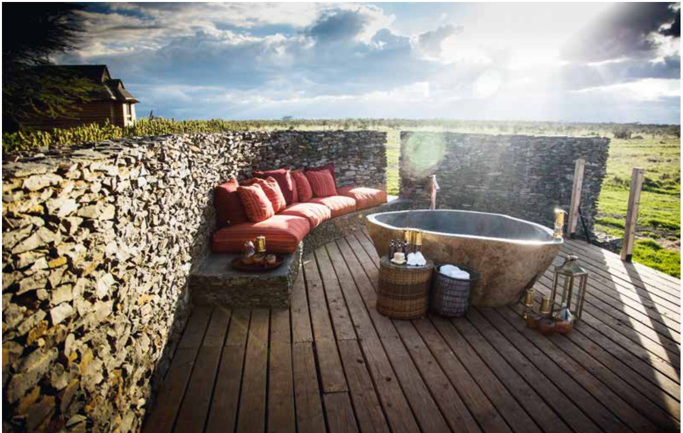
Oben: Badewanne mit Blick in die Wildnis: Wer eine Villa in Segera gebucht hat, darf sich hier den Safari-Staub abspülen.

Above: A bath with a view. Book a Segera villa and you can wash off all the safari dust in these spectacular surrounds.