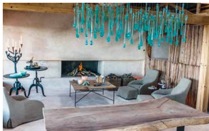
In den ehemaligen Pferdeställen wurde ein gemütlicher Barbereich eingerichtet. Der Esstisch ist eine Massanfertigung, die extravagante Lampe ist aus Nairobi.

“I want my visitors to take home more than the memories of a great safari,” Jochen Zeitz concludes. “I want them to go home thinking, ‘How can I help?’ That’s the aim of the whole project. And the Segera retreat has an integral role here,” he continues. “I see it as a meeting place for people who are interested in the whole idea of sustainability and want to play their part.” Jochen freely admits that he can learn from the process as well, even if it’s just the ability to take a break. “I do find it hard to switch off,” he concedes. “There’s so much we can do on the sustainability front, which is both hugely important and great fun.” There are few places more conducive to doing so than Segera though – should he ever tire of flying his plane ... •